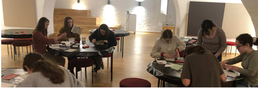
BYG EN BOG Eleverne fra værkstedet bygger deres egen bog ved brug af gammelt boghåndværk.