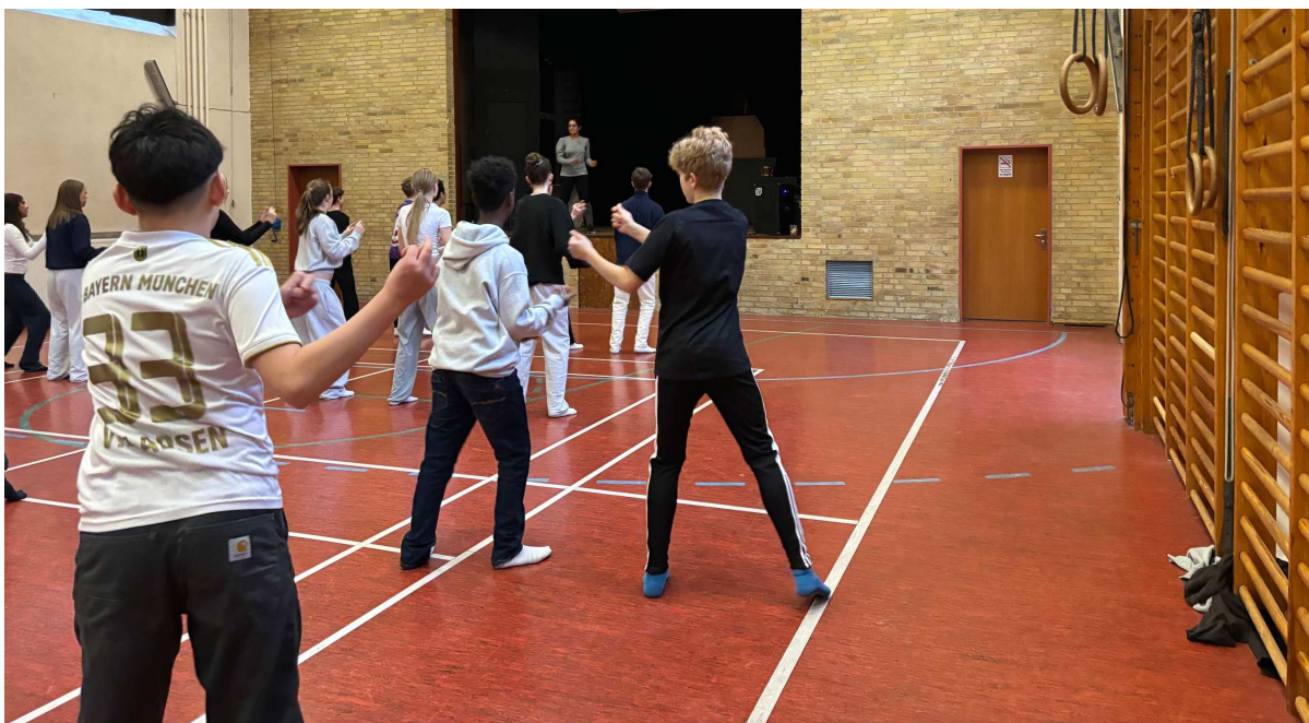
BOLLYWOOD Dansende elever

Niels Steensens Gymnasium København Ø januar 2024 ID: 6427