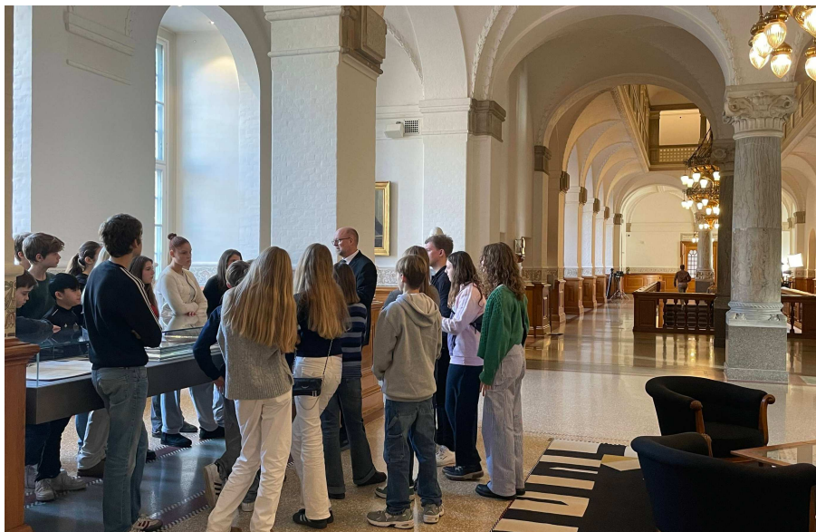
FOLKETINGET Eleverne besøgte Folketinget og så også Statsministeren