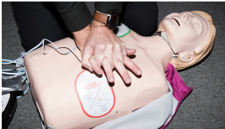
FØRSTEHJÆLP Der bliver givet førstehjælp på en dukke.