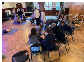
Eleverne lærer førstehjælp på dukker