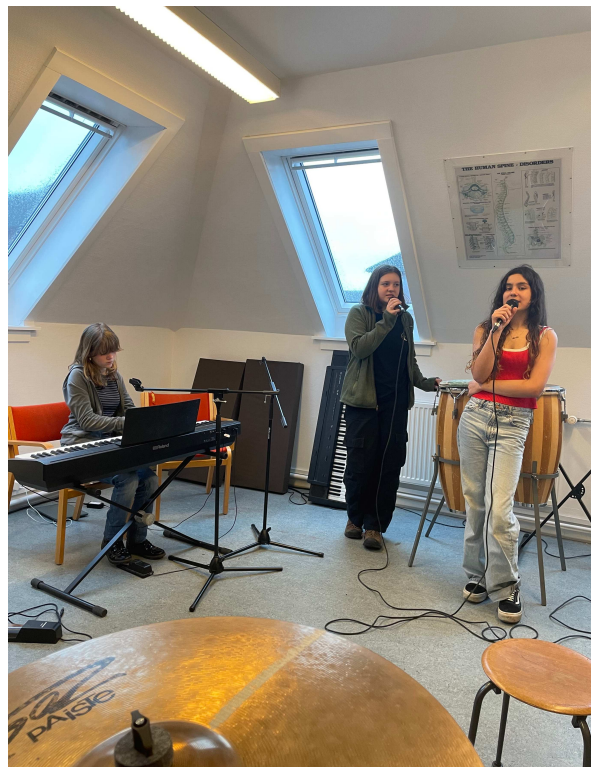
BAND Sangprøver

I samme bygning fik de så en anden opgave at dele en masse madvarer op i de forskellige smagskategorier, de opgaver klarede de så godt. De sluttede af i kantinen hvor de kunne købe noget mad fra skolen.