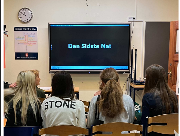
FILMPRODUKTION Skal findes et andet billede

Kampssport har været dyrket i mange tusind år, og bliver stadig dyrket den dag i dag. De ældste former for kampssport er blevet set på gamle malerier fra 3000 f.kr, hvor to mænd sloges med boksehandsker på. Der findes mange forskellige kampssporter, som er blevet dyrket igennem tiden fx jiu-jitsu, Kung Fu, boksning, brydning og karate.