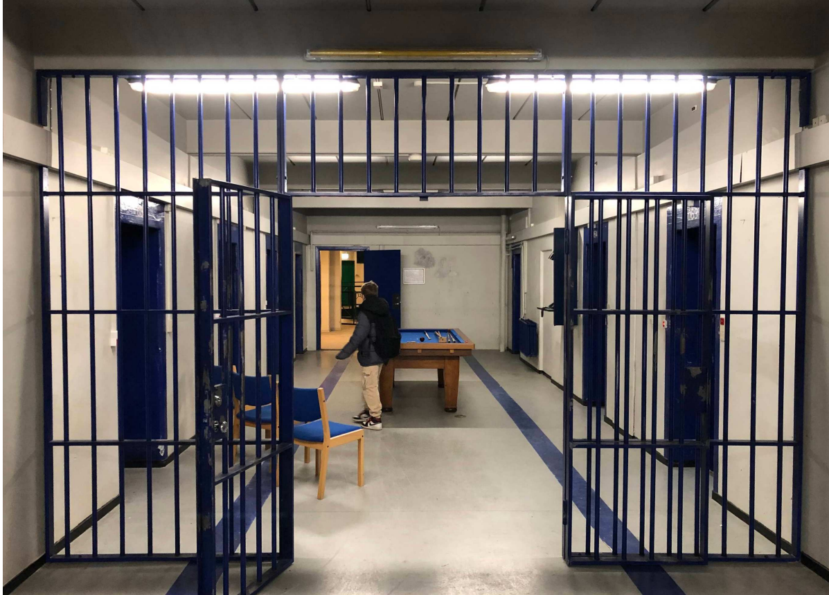
PÅ TUR Vridsløselille Fængsel