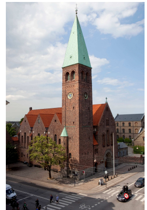
Sankt Andreas Kirke