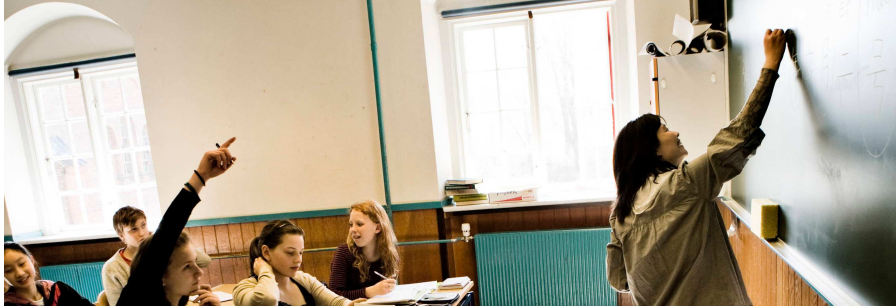
EMNEUGEN I emneugen er eleverne væk fra tavleundervisningen.