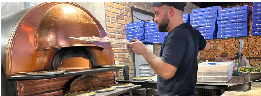
Ejeren sætter elevernes pizzaer ind i pizzaovnen