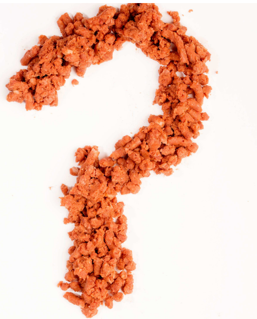
NSG News har spurgt eleverne om emneugen.